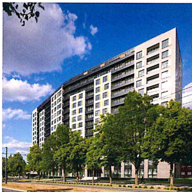
Met zijn opvallende voorgevel creëert 'Fenix' een mooie architecturale meerwaarde in de omgeving.

Bouwtechnisch gezien was 'Fenix' geen gigantisch moeilijk project, maar het bleef natuurlijk wel een totaalrenovatie, wat betekent dat je altijd voor verrassingen komt te staan. Om het aantal onverwachte situaties te minimaliseren, hebben we onze tijd genomen om het bestaande gebouw grondig in te meten, waardoor we goed op de hoogte waren van de toestand van het pand. Een extra moeilijkheid in dit project was het feit dat het gebouw een Delhaizewinkel huisvest, die ook tijdens de werken open moest blijven – uiteraard met zo weinig mogelijk hinder voor de klanten. Maar uiteindelijk is alles goed verlopen en is Fenix echt wel een mooie referentie geworden." ■